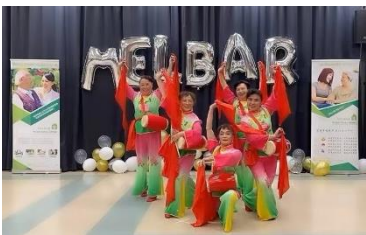
来自澳大利亚宋庆龄基金会艺术团同时也是Melbar客户的5位长者带来舞蹈《欢庆腰鼓》